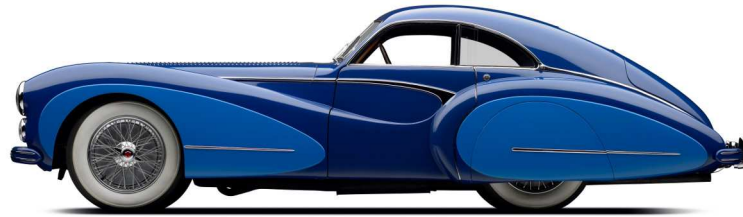
TALBOT LAGO Type T26 Grand Sport 1947

Moteur 6 cylindres en lignes de 4.500 cm 3 Coupé 2 places réalisé par Jacques Saoutchik, carrossier à Neuilly sur Seine. Ce coupé était une des automobiles françaises les plus rapides du marché de l'après-guerre.