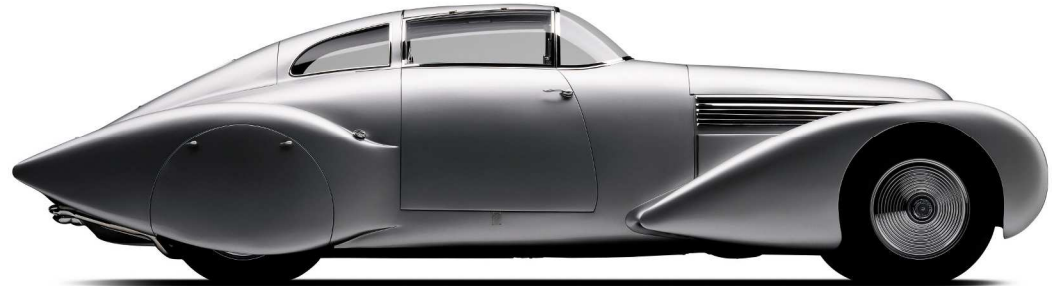
HISPANO-SUIZA TYPE H6 C

Moteur 6 cylindres en ligne de 8.000 cm 3 Réalisé par la carrosserie Saoutchik, à Neuilly sur Seine pour André Dubonnet, héritier de l'apéritif éponyme, également pilote automobile et inventeur d'un brevet de suspension révolutionnaire. Cachée pendant la deuxième guerre mondiale, elle inaugure le tunnel de St Cloud en 1946. Cette voiture a récolté des prix d'élégance dans les plus grands concours du monde.