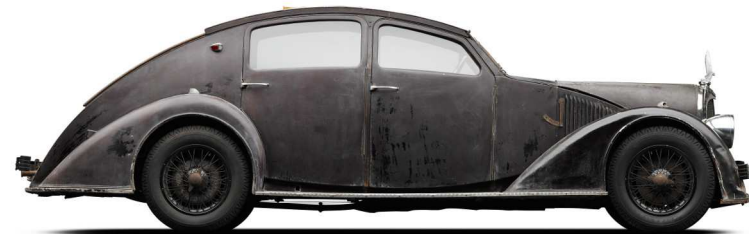
VOISIN Type C25 Aérodyne 1934

Moteur 6 cylindres en ligne sans soupape Sur les 7 véhicules construits, 5 survivent. Ils avaient un profil aérodynamique en forme d'aile d'avion. Équipé d'un toit coulissant pneumatique. Garni de tissu intérieur dans le pur style Art Déco. Cet extraordinaire véhicule a remporté le « Best of show » au très convoité concours de Pebble Beach en août 2011.