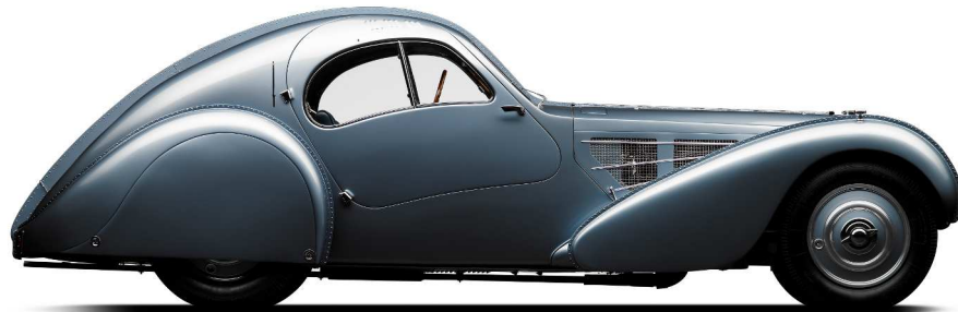
BUGATTI type 57SC Atlantic châssis n° 57374

Moteur 8 cylindres en ligne à compresseur à 2 arbres à came en tête.