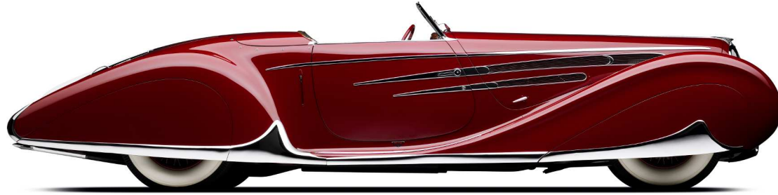
DELAHAYE V12 Type 165 châssis 60744