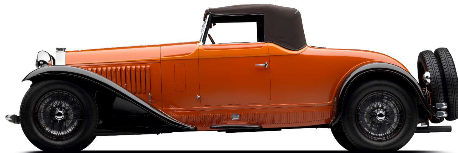
BUGATTI type 46 châssis n° 46360

Moteur 8 cylindres en ligne. Carrosserie cabriolet 2 places réalisée par De Villars à Courbevoie. Vendue neuve à Paris en 1930 cette automobile fut retrouvée en Grèce en 1999.