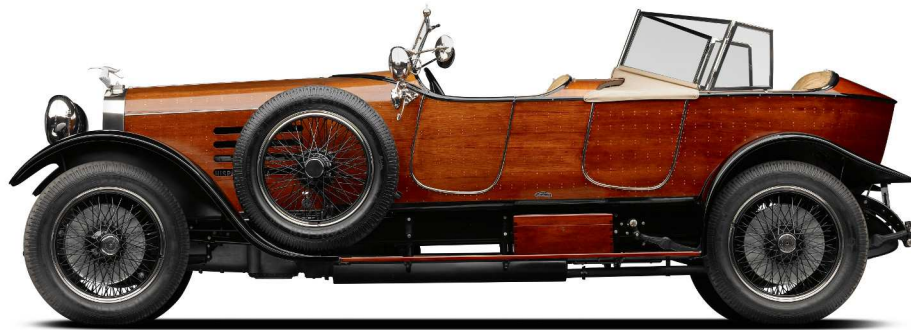
HISPANO-SUIZA Type H6 B

Moteur 6 cylindres en ligne de 6.600 cm 3 Skiff en acajou riveté réalisé par Henri Labourdette. Réalisée spécialement en 1923 pour Suzanne Deutsch de la Meurthe.