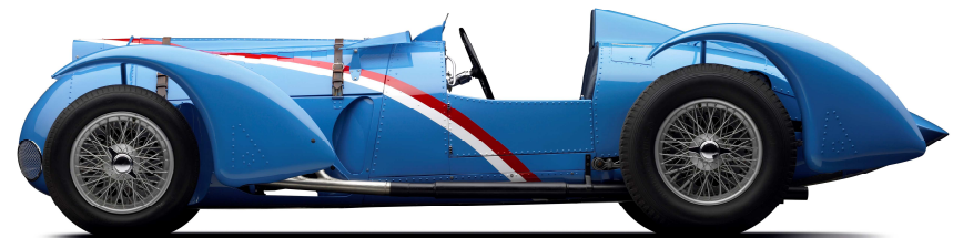
DELAHAYE V 12 type 145 châssis n°48771

Entièrement restaurée dans sa configuration du GP du Million, la voiture est parfois utilisée par son propriétaire dans des courses et démonstrations de véhicules historiques.