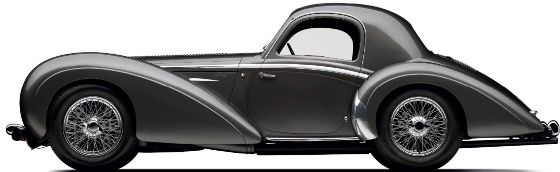
DELAHAYE V12 Type 145 châssis n° 48773